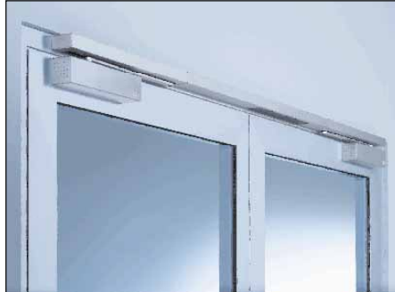
TS 93 im Contur Design