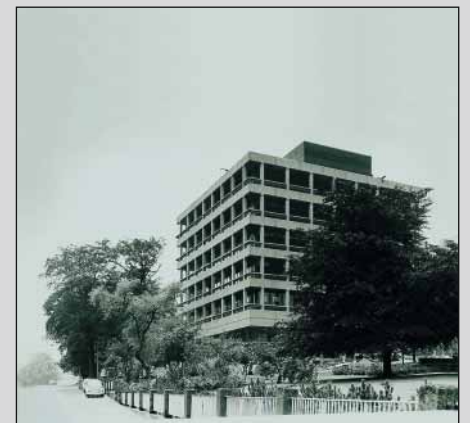
DORMA Hauptverwaltung Ennepetal 1969