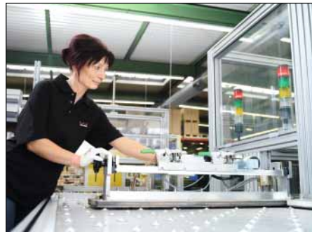
Prüfereinheit für automatische Türantriebe ES 200