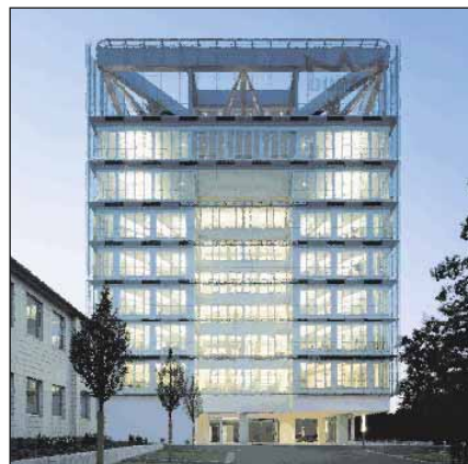
DORMA Hauptverwaltung Ennepetal 2008