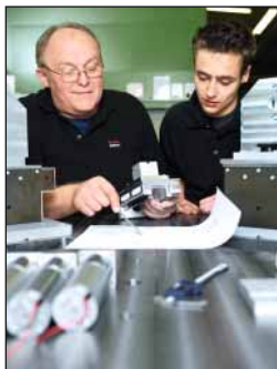
DORMA Ausbildung im Werkzeugbau