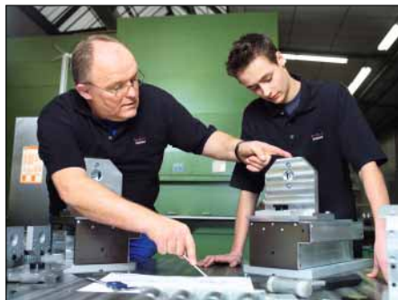
DORMA Ausbildung im Werkzeugbau