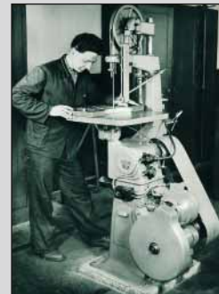
Bandsäge im Werkzeugbau aus der Vorkriegszeit